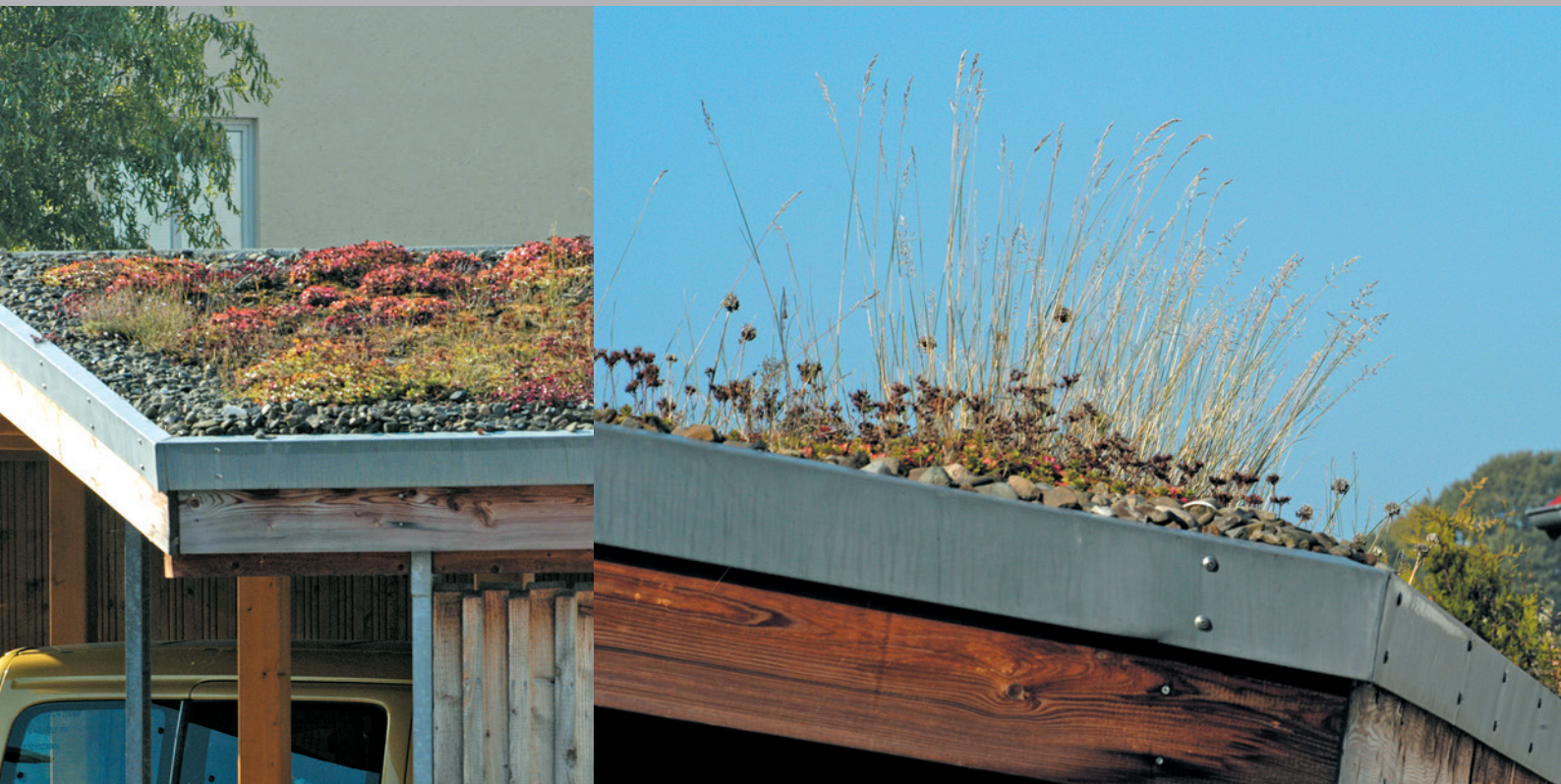
Dachbegrünung Siedlung Bovenden ExtruBit Dachabdichtung, 850 m 2