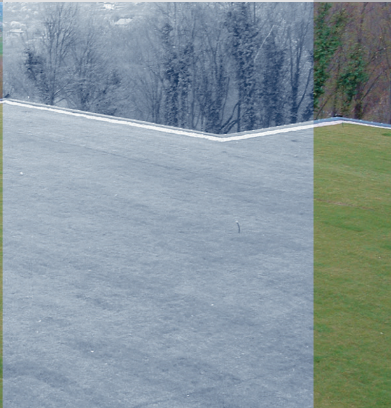
Dachbegrünung Hotel Kulmer, Zagreb ExtruBit Dachabdichtung, 1.000 m 2