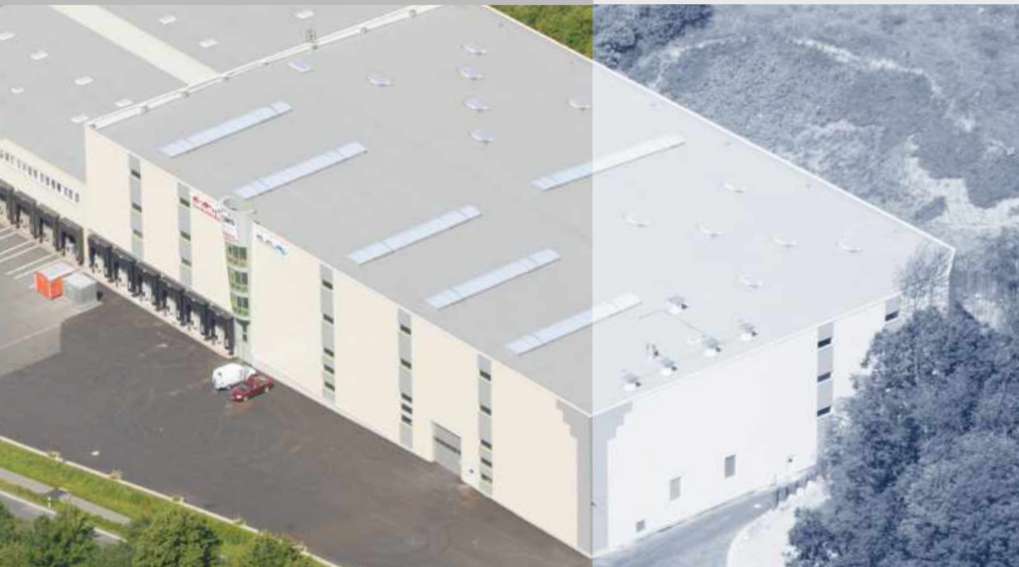
Pufas, Hann. Münden ExtruPol Dachabdichtung, 7.100 m 2