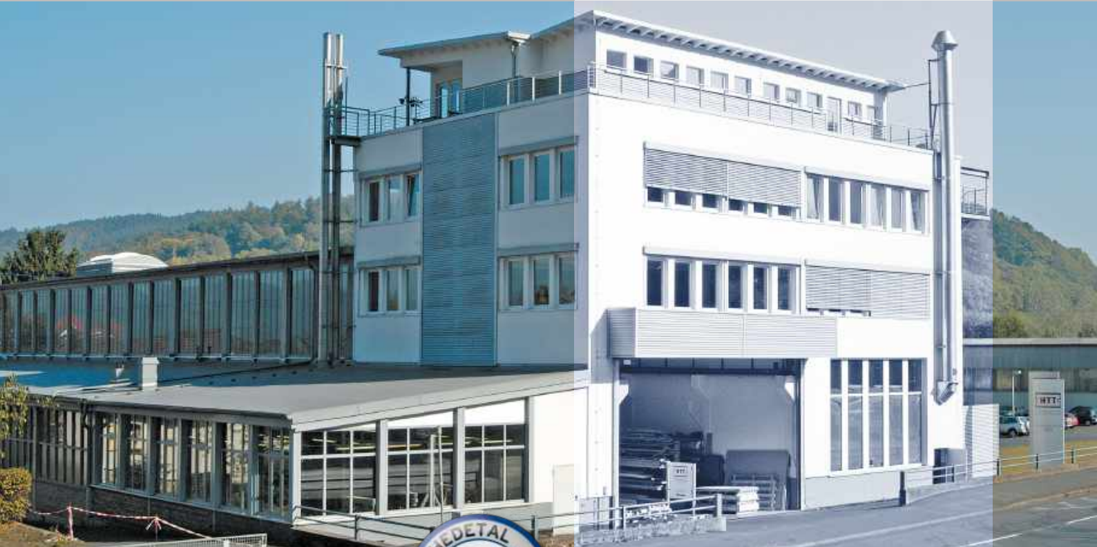
HTT, Hann. Münden ExtruPol Dachabdichtung, 4.000 m 2