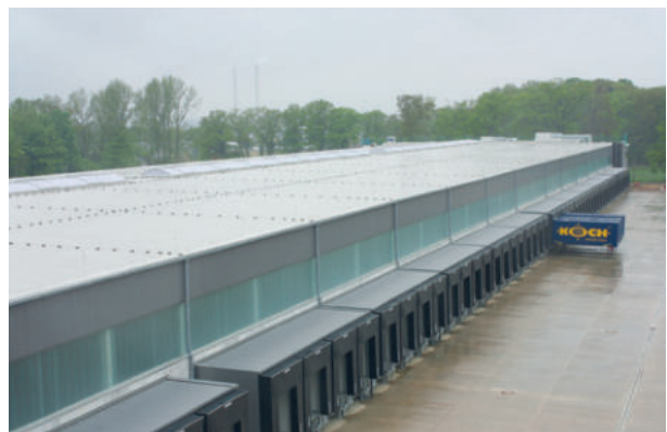
LGZ Koch, Osnabrück, ExtruPol Dachabdichtung, 27.000 m²