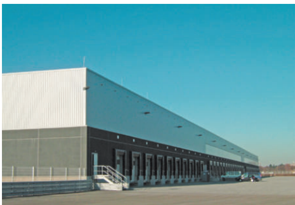
Lidl Logistikzentrum, Leverkusen, ExtruBit Dachabdichtung, 33.000 m 2