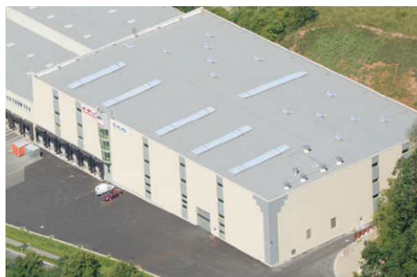
Pufas, Hann. Münden, ExtruPol Dachabdichtung, 7.100 m²