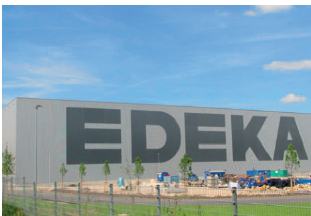
EDEKA, Landsberg ExtruPol Dachabdichtung, 27.000 m 2