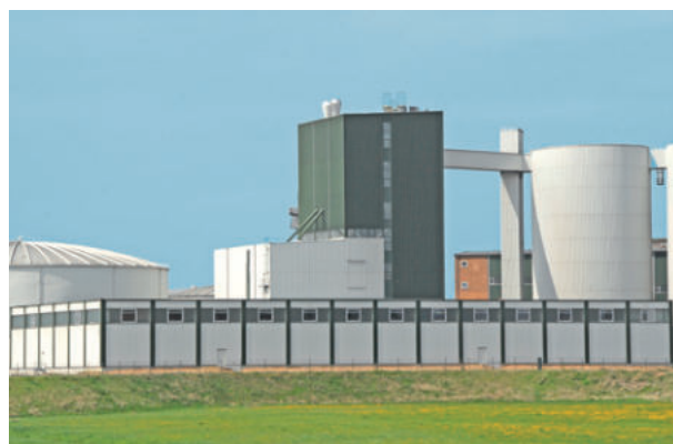
Südzucker AG, Mannheim, ExtruPol Dachabdichtung,, 4.000 m²