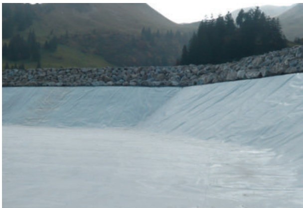
Speichersee Stoos, Schweiz, ExtruPol, 8.500 m 2