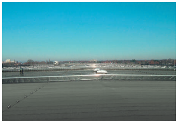
H&N-Versandlager, Hann. Münden, ExtruBit Dachabdichtung, 11.000 m 2