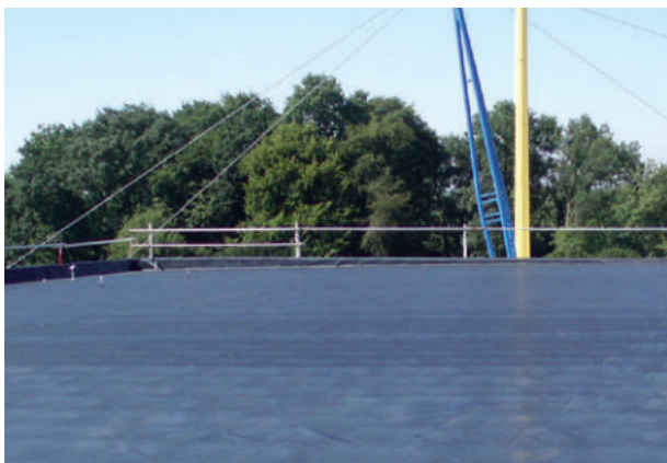
Eissporthalle, Grefrath, ExtruBit Dachabdichtung, 4.000 m 2