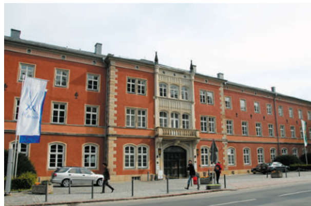
Produktionshalle Porzellanmanufaktur Meissen, Meißen ExtruPol Dachabdichtung, 2.500 m²