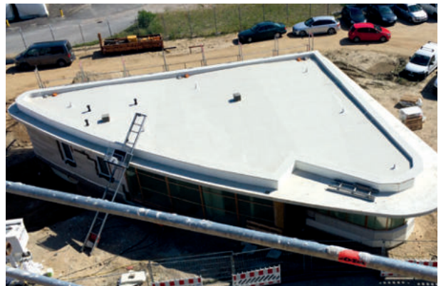
Stadtwerke Lübeck ExtruPol Dachabdichtung 2.800m 2