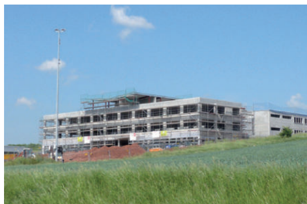
Mobotix AG Firmengebäude, Kaiserslautern ExtruPol Dachabdichtung, 6.000 m²