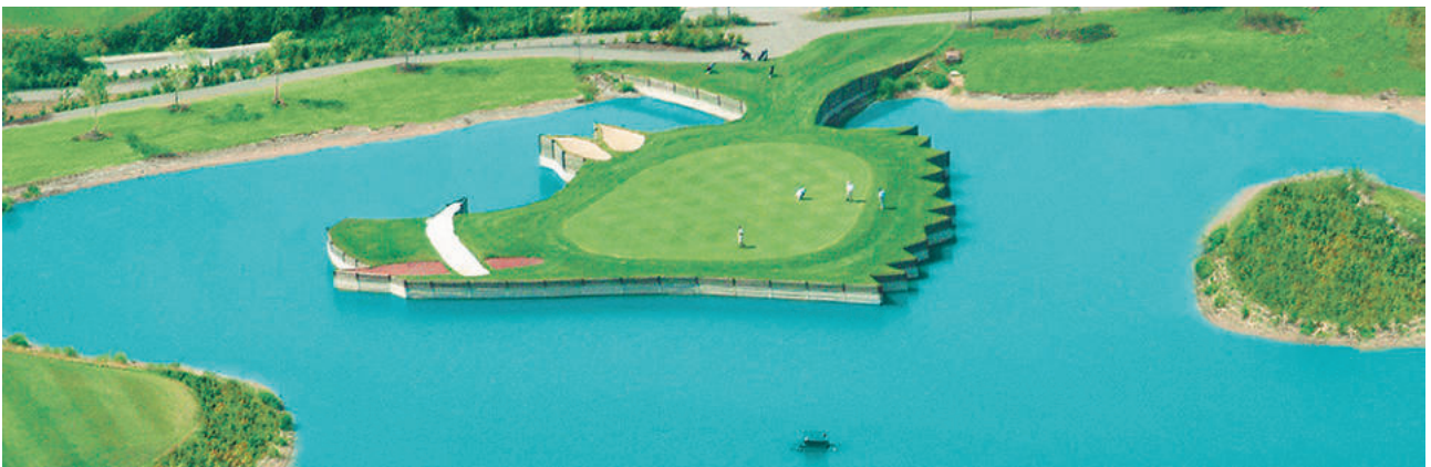
Golfclub Hardenberg e. V., Gut Levershausen, ExtruPol Basisabdichtung, 1.400 m 2