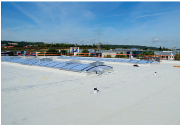
Sartorius AG, Göttingen ExtruPol Dachabdichtung 2.300 m 2