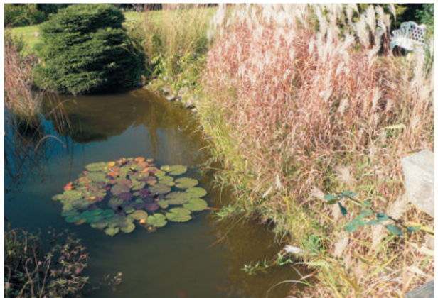
Porta Westfalica, ExtruBit Teichabdichtung, 80 m 2