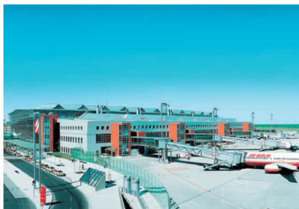
Flughafen Dresden ExtruPol Dachabdichtung, 6.350 m 2