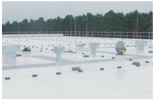
Pufas, Hann. Münden, ExtruPol Dachabdichtung, 7.100 m²