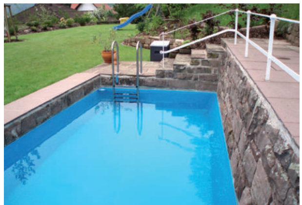
Privatschwimmbad, Hann. Münden, ExtruPol blau