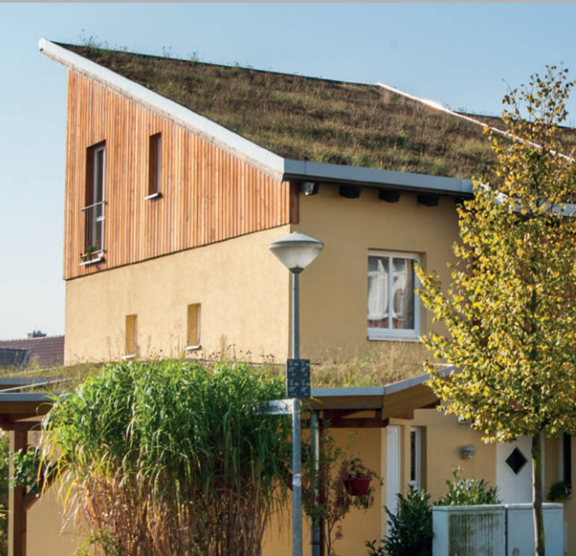
Hann. Münden, ExtruBit Teichabdichtung, 100 m 2