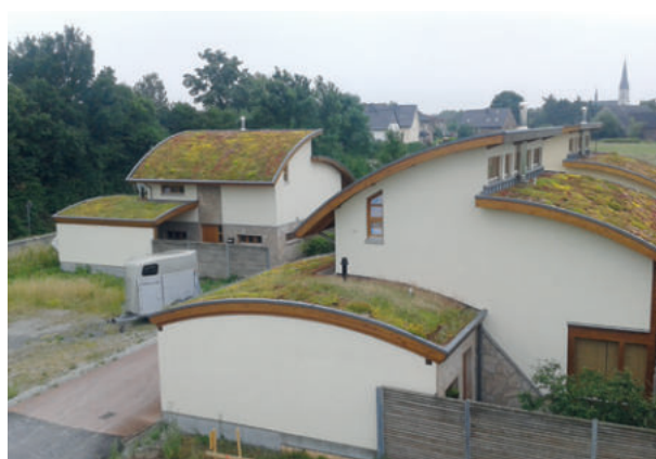
Bogenh6user, Herzfeld ExtruPol Dachabdichtung, 500 m 2