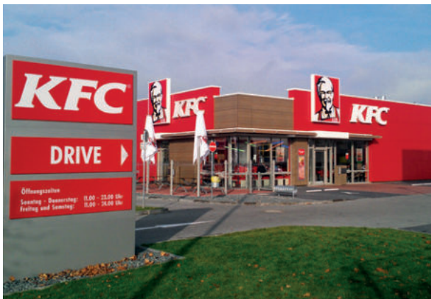
KFC Schnellrestaurant, Göttingen ExtruPol Dachabdichtung, 500 m 2