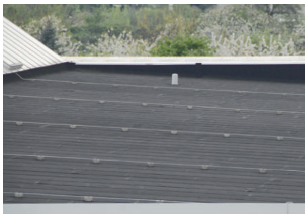
Dresdner Verkehrsbetriebe AG, Dresden, Dachabdichtung ExtruBit 10.000 m 2 und ExtruPol 6.000m 2