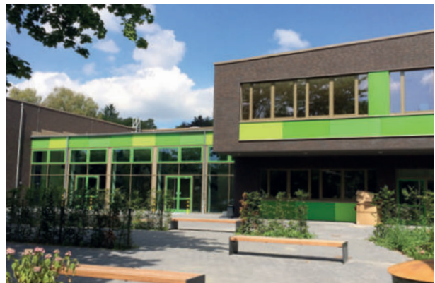
BBS Göhlbachtal, Hamburg ExtruPol Dachabdichtung, 3.000 m²