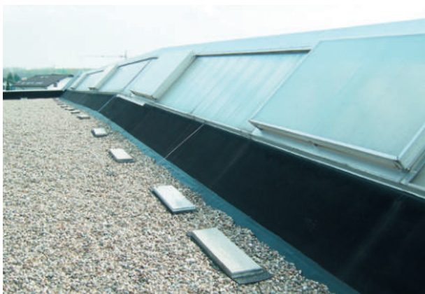
Baumarkt, Baden-Baden, ExtruBit Dachabdichtung, 4.500 m 2