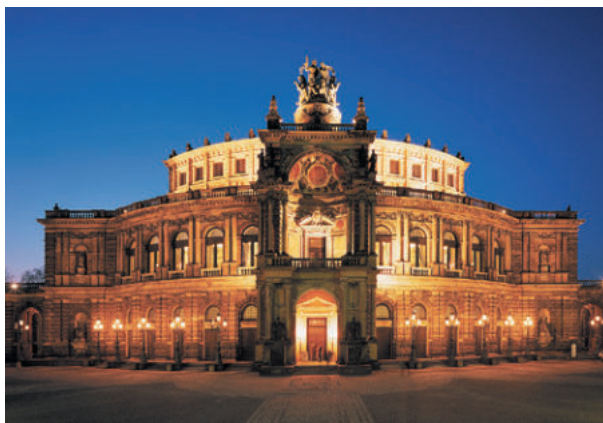
Semper Oper Dresden, ExtruBit Dachabdichtung, 1.800 m 2