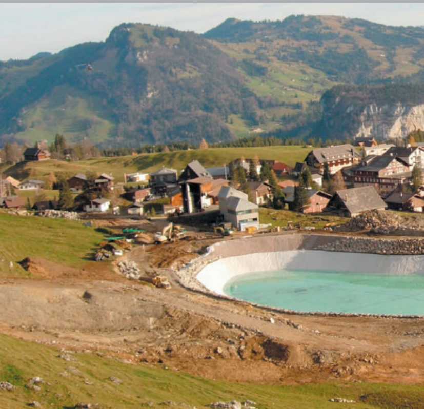
Speichersee Stoos, Schweiz ExtruPol, 8.500 m 2