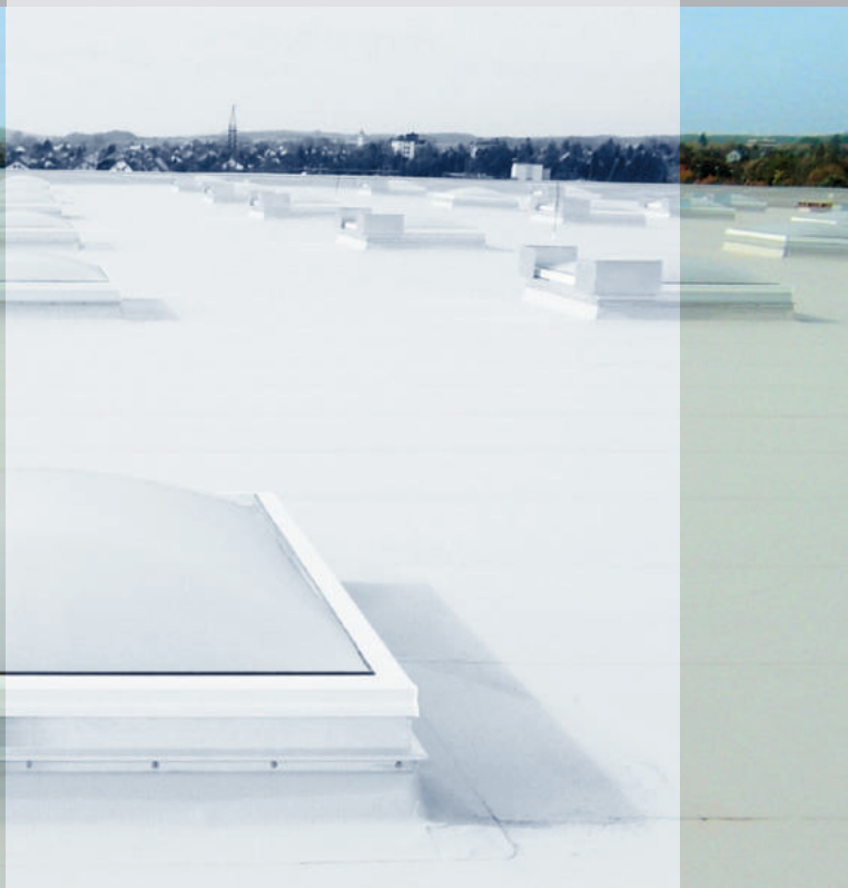
Lekkerland, H6chstadt ExtruPol Dachabdichtung, 11.000 m 2