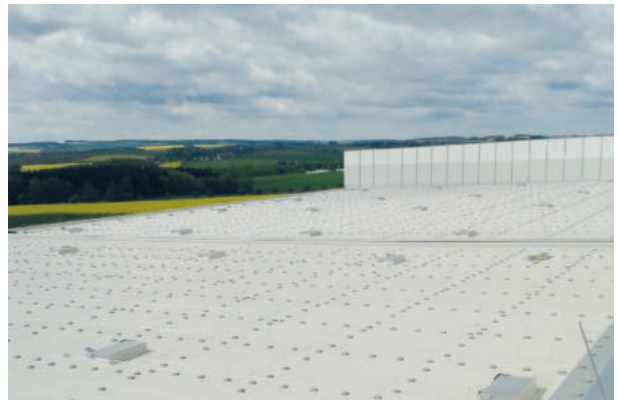
EDEKA Zentrallager, Berbersdorf ExtruPol Dachabdichtung 30.000m 2