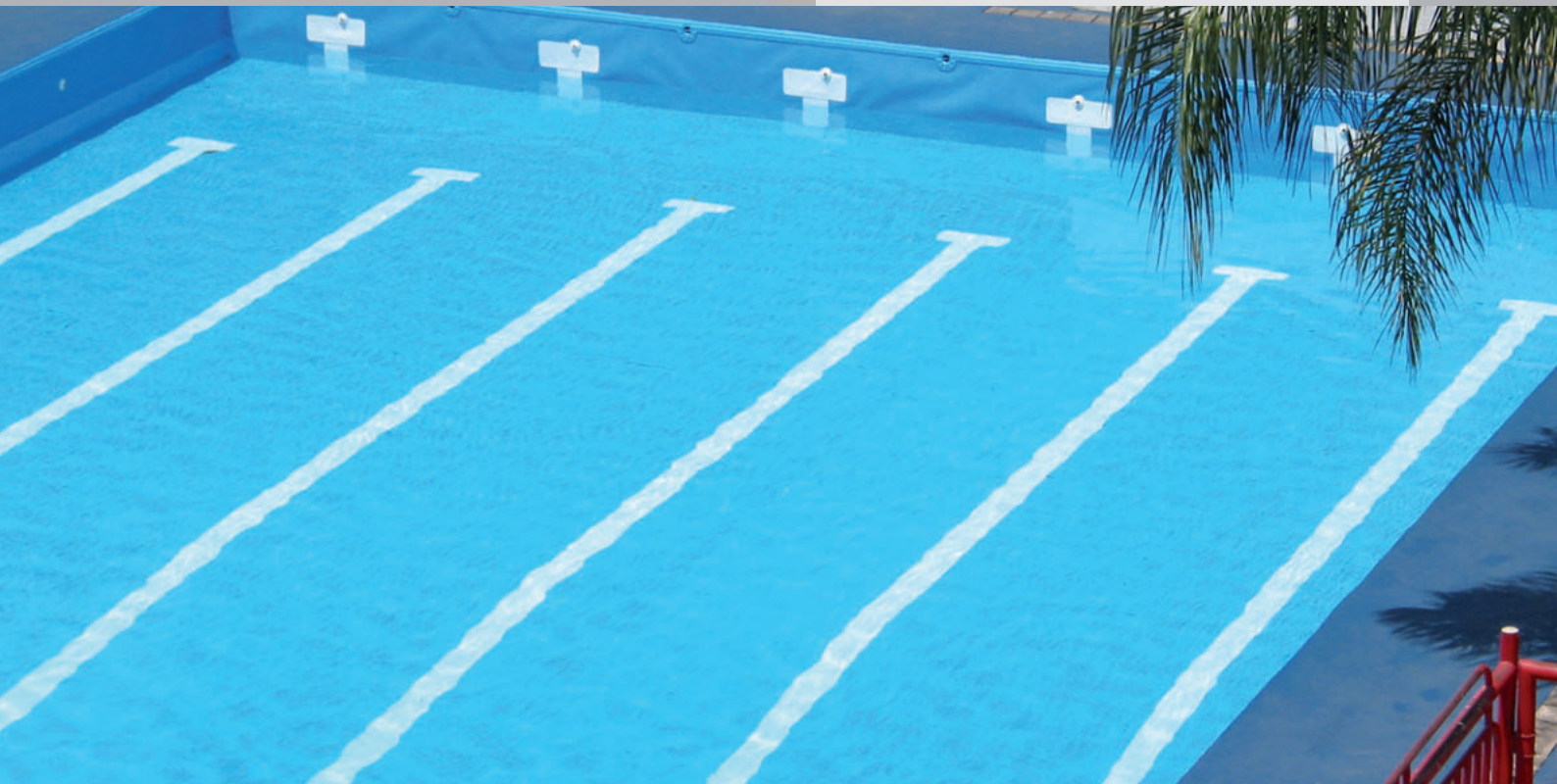
Schwimmbad, Mexico City, ExtruPol blau