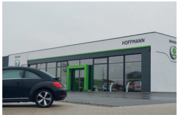
Skoda Autohaus, Burgwald Bottendorf ExtruPol Dachabdichtung 1.800m 2