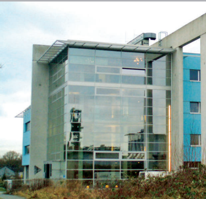
Bürogebäude, Bochum ExtruBit Dachabdichtung, 2.500 m 2