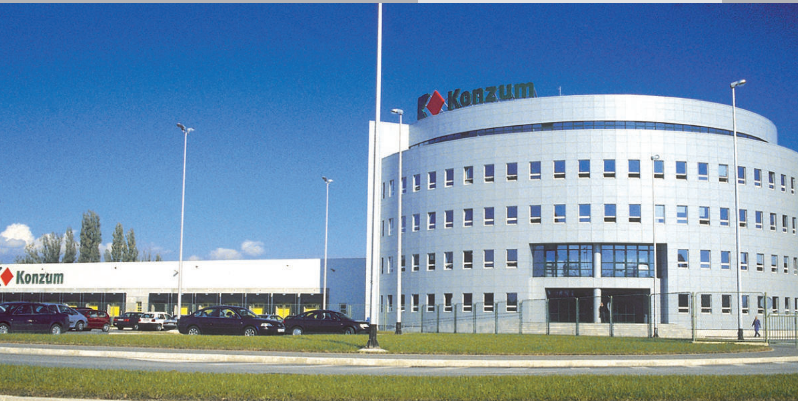
Konzum Zagreb/Kroatien ExtruBit Dachabdichtung, 25.000 m 2