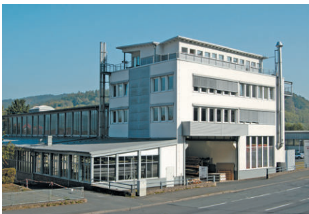
HTT, Hann. M6nden ExtruPol Dachabdichtung, 4.000 m 2