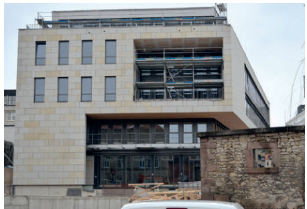
Quartier am Leinebogen, Göttingen ExtruPol Dachabdichtung 2.000 m 2