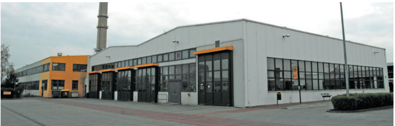
DVB Dresdner Verkehrsbetriebe AG, ExtruBit Dachabdichtung, 10.000 m 2 ; ExtruPol Dachabdichtung, 4.000 m 2