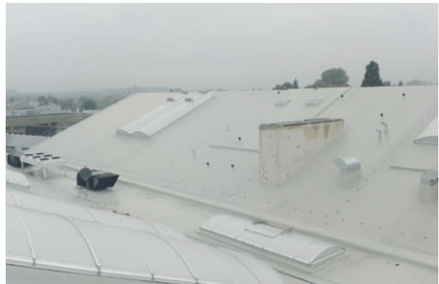
Tennishalle/Fitness, Krefeld ExtruPol Dachabdichtung, 5.000 m²