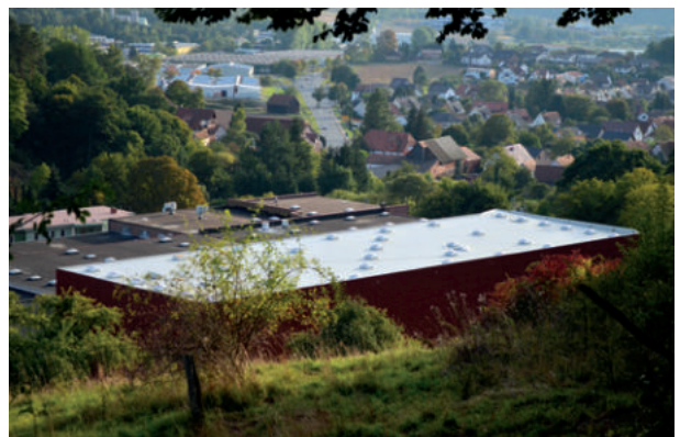
PUFAS Werk, Hann. Münden, ExtruPol Dachabdichtung, 2.500m 2