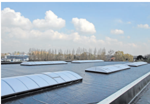
Industriehalle Simpelkamp, Krefeld, ExtruBit Dachabdichtung, 13.000 m 2