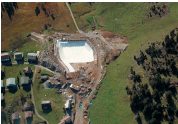
Speichersee Stoos, Schweiz, ExtruPol, 8.500 m 2