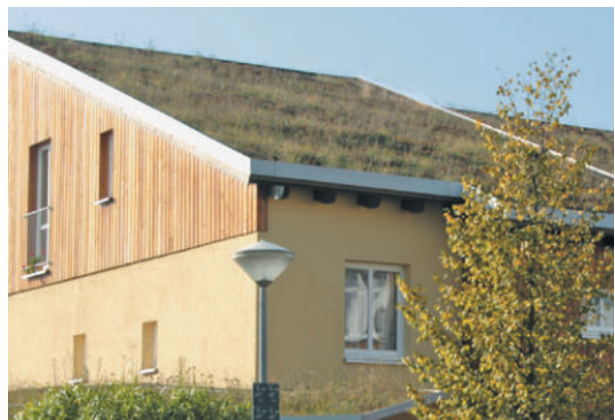
Gründach-Siedlung Bovenden, ExtruBit Dachabdichtung, 850 m 2