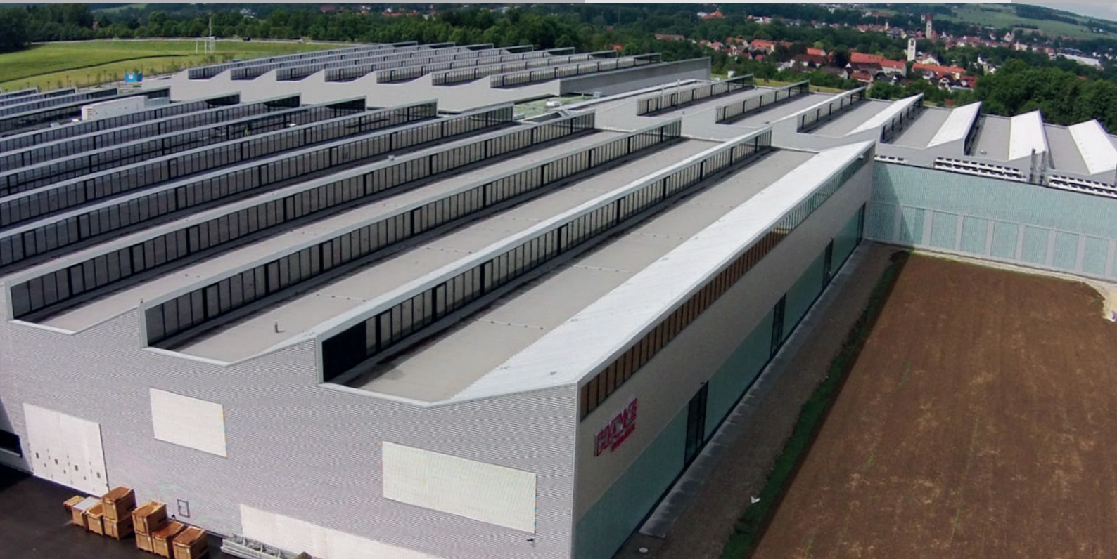
HAWE Hydraulik, Kaufbeuren ExtruPol Dachabdichtung 40.000 m 2