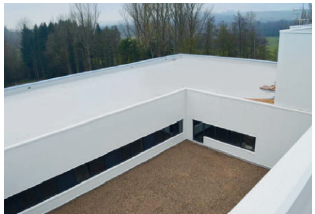
Infineon Warstein, ExtruPol Dachabdichtung, 3.500 m 2