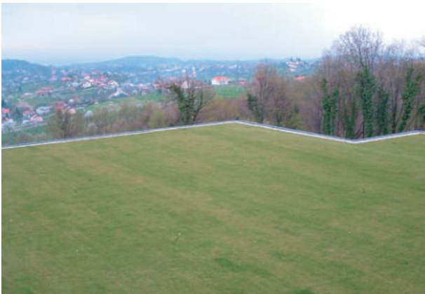
Dachbegrünung Hotel Kulmer, Zagreb/Kroatien ExtruBit Dachabdichtung, 1.000 m 2